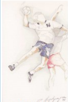
HANDBALL OFFIZIELLER SPONSOR

Einladung zur Generalhauptversammlung des ASC Laugen Tisens, welche am